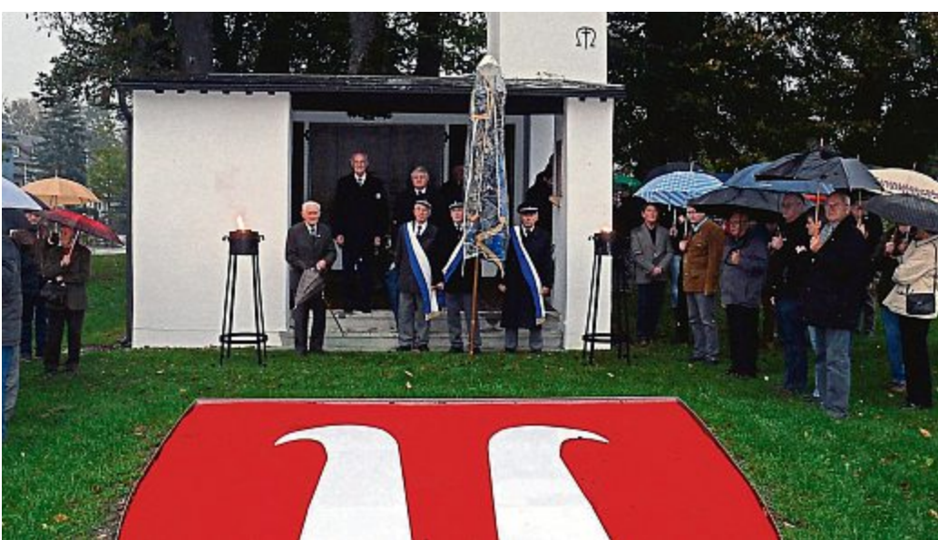
Gedenken an die Verstorbenen: die Mitglieder der Krieger- und Soldatenkameradschaft Altenerding vor dem neu gestalteten Kriegerdenkmal am Hofmarkplatz.

Mit einem Gottesdienst und anschließendem Beisam-